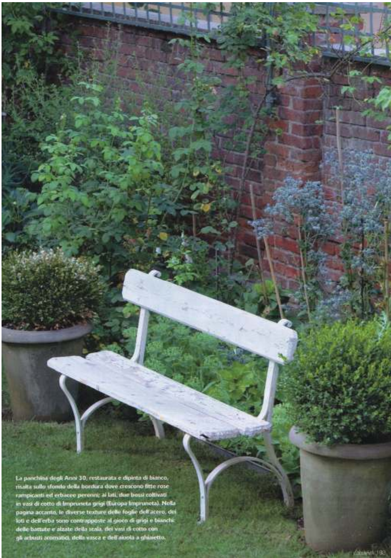
La panchina degli Anni 30, restaurata e dipinta di bianco, risalta sullo sfondo della bordura dove crescono fitte rose rampicanti ed erbacee perenni; ai lati, due bossi coltivati in vasi di cotto di Impruneta grigi (Europa Impruneta). Nella pagina accanto, le diverse texture delle foglie dell'acero, dei liti e dell'erba sono contrapposte al gioco di grigi e bianchi delle battute e alzate della scala, dei vasi di cotto con gli arbusti aromatici, della vasca e dell'aiuola a ghiaietto.