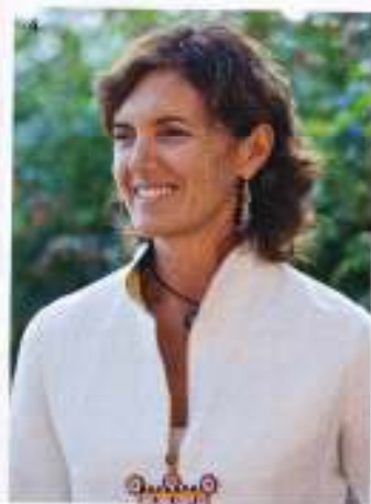
1. Il giardino del Castello di Sissinghurst, nel Kent. Creato negli anni 30 dalla scrittrice inglese Vita Sackville-West (6), oggi è gestito e curato dal National Trust. Nelle altre foto, alcuni tra i più noti paesaggisti italiani: 2. Paolo Pejrone; 3. Patrizia Pozzi; 4. Anna Maria Scaravella; 5. Cristiana Ruspà.

andranno scelte con cura affinché siano loro garantite le condizioni migliori per prosperare: andranno acquistate quelle adatte a clima ed esposizione , nelle dimensioni più appropriate al tipo di coltivazione, presso vivaisti di buona reputazione (vedi box). La provenienza delle piante non è, infatti, un elemento secondario: devono essere coltivate in vasi di dimensioni congrue a quelle della pianta, non presentare ferite né grandi tagli, e mostrare un portamento ordinato e arioso, tutti sintomi di buona salute.